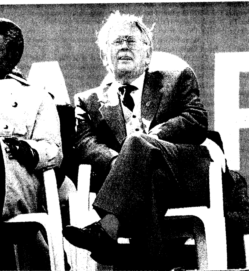
Joe Slovo, leder af det sydafrikanske kommunistparti, overværer i fællesskab oweto.

ariteten af Fidel Castros socialismens overlegenhed