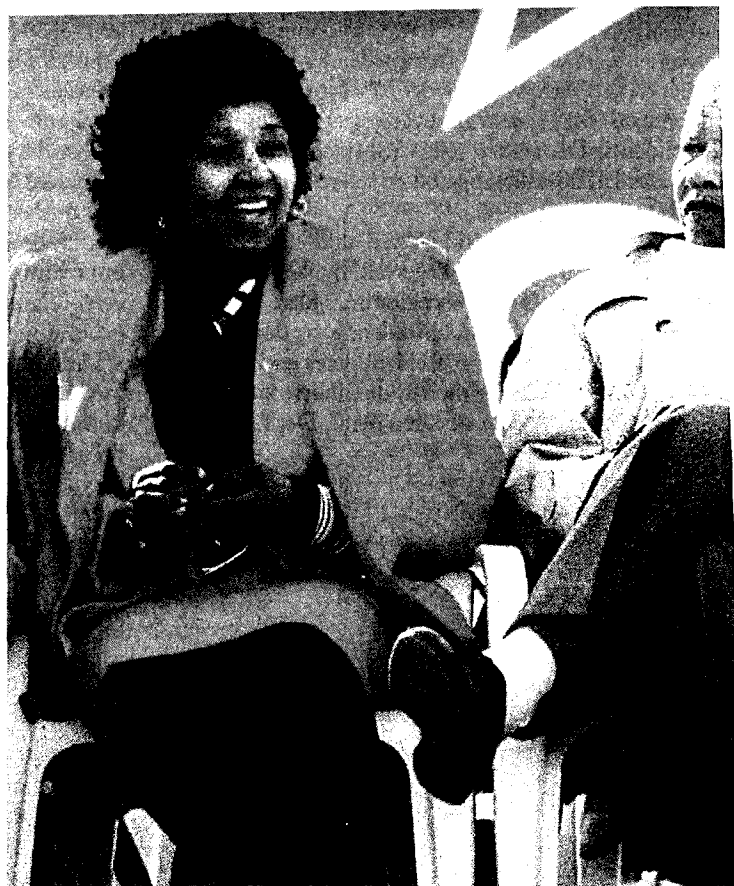
Præsident Nelson Mandela, hans daværende hustru Winnie Mandela (til venstre) og medlemmer af det stiftende møde i det nu lovlige kommunistparti den 29. juli 1990 i Johannesburg.